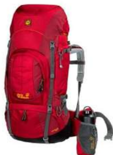
рюкзак для активного спорта (15-20 л)