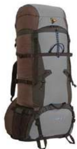
рюкзак для альпинизма (не более 50 л)

экспедиционные (от 80 л) туристические (от 50 до 80) трекинговые (40-50)